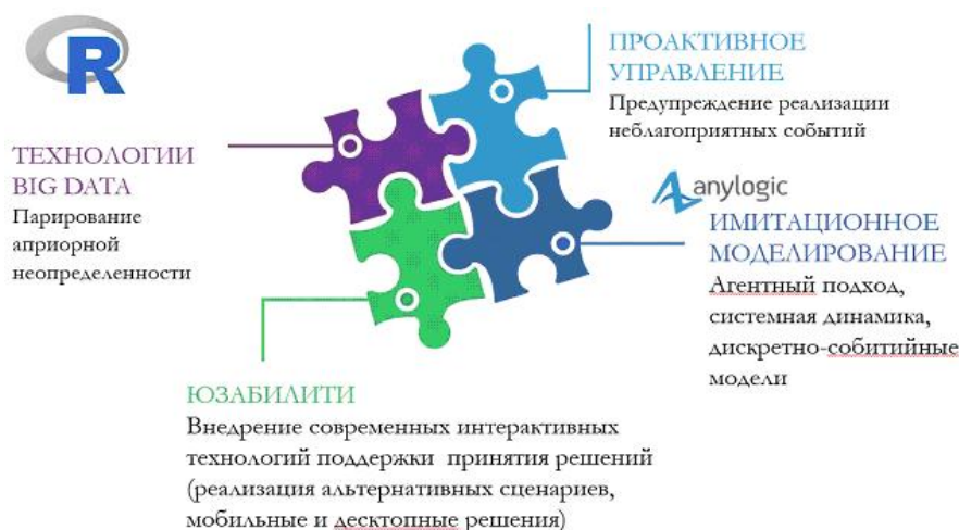
Рис. 1. Обобщенная схема описания предлагаемого гибридного подхода

В рамках среды модули SparkR, H2O, Radoop используются для создания инфраструктуры анализируемых данных и выработки типовых решений обращения и манипуляции мультиструктурными данными. Работа с инсайтами, их выявление, классификация и определение наиболее оптимальных способов применения, проводится с использованием междисциплинарного подхода, базирующего на комплексном использовании технологий аналитического и имитационного моделирования и методах DataScience, включающих как элементы многомерного статистического анализа и шкалирования, так и методы машинного обучения.