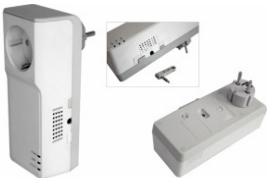
Рис. 3 GSM розетка

Идея продукта возникла из переосмысления известного устройства GSM сигнализации – GSM розетки (рисунок 3)