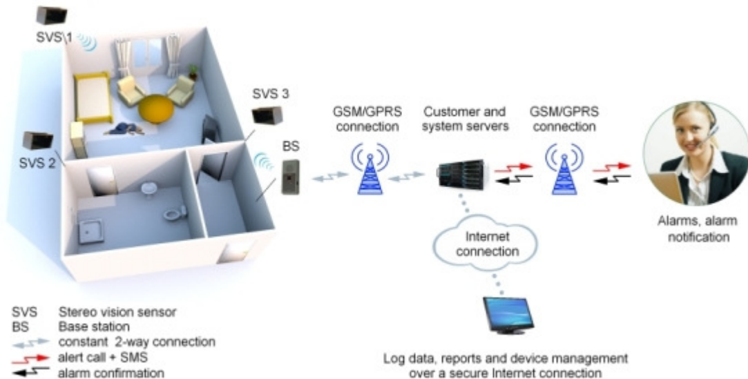
Рис 2. AAL program

В настоящей работе мы описываем простое в эксплуатации устройство, которое относится к направлениям, охватываемым программой AAL. Это мониторинг физической активности, основанный на анализе использования электрических приборов в доме.