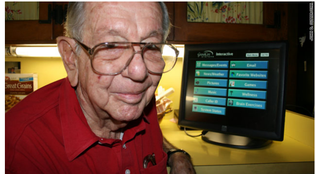
Рис. 1 Home monitor [6]

М. А. Шнепс-Шнеппе – ведущий научный сотрудник ЦНИИС (e-mail: sneps@mail.ru).