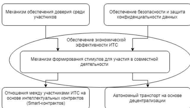
Рис. 2. Направления исследований децентрализованных технологий в сфере городского транспорта

В этом разделе мы обобщим ключевые направления использования технологии блокчейн на основе анализа публикаций [1,22–25] и сформулируем проблемы становления технологии в сфере городского пассажирского транспорта, на которые указывают ведущие исследователи. Также мы кратко обсудим потенциальные направления дальнейших теоретических исследований в данной области. На рисунке представлено концептуальное видение механизмов формирования стимулов совместной деятельности в рамках системы ИТС ГПТ. Рассмотрим каждый из аспектов по отдельности с учетом перспектив использования технологий блокчейн для их реализации.