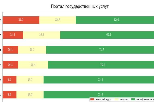
Рис. 5. Распределение ответов респондентов на вопрос «Пользуетесь ли Вы Порталом государственных и муниципальных услуг», в %

Кроме того, достаточно распространенными даже в старших возрастных группах являются онлайн обращения по решению городских проблем, голосования по проектам инициатив, публикация жалоб на действия властей и специализированных служб. Наименьшей популярностью пользуются краудсорсинговые платформы, порталы инициативного бюджетирования и т.д.