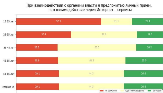
Рис. 3. Распределение ответов респондентов на вопрос «При взаимодействии с органами власти я предпочитаю личный прием, чем взаимодействие через Интернет», в %

Исследованием было отмечено, что наряду с другими эффектами, пользователи электронных сервисов особенно отмечают экономию времени по сравнению с традиционными способами получения. Причем представители старших возрастных групп практически в 1,5 раза сильнее признают этот эффект (рис.4).