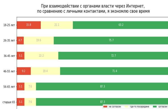
Рис. 4. Распределение ответов респондентов на вопрос «При взаимодействии с органами власти через Интернет, по сравнению с личными контактами, я экономлю свое время», в %

Исследованием было отмечено, что наряду с другими эффектами, пользователи электронных сервисов особенно отмечают экономию времени по сравнению с традиционными способами получения. Причем представители старших возрастных групп практически в 1,5 раза сильнее признают этот эффект (рис.4).